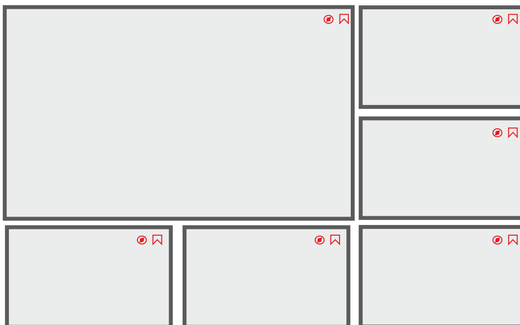
Ilustracja 1: Układ portfolio najpopularniejszych atrakcji

Galeria – portfolio 6 najpopularniejszych na stronie atrakcji turystycznych. Ułożone w zbliżony sposób: