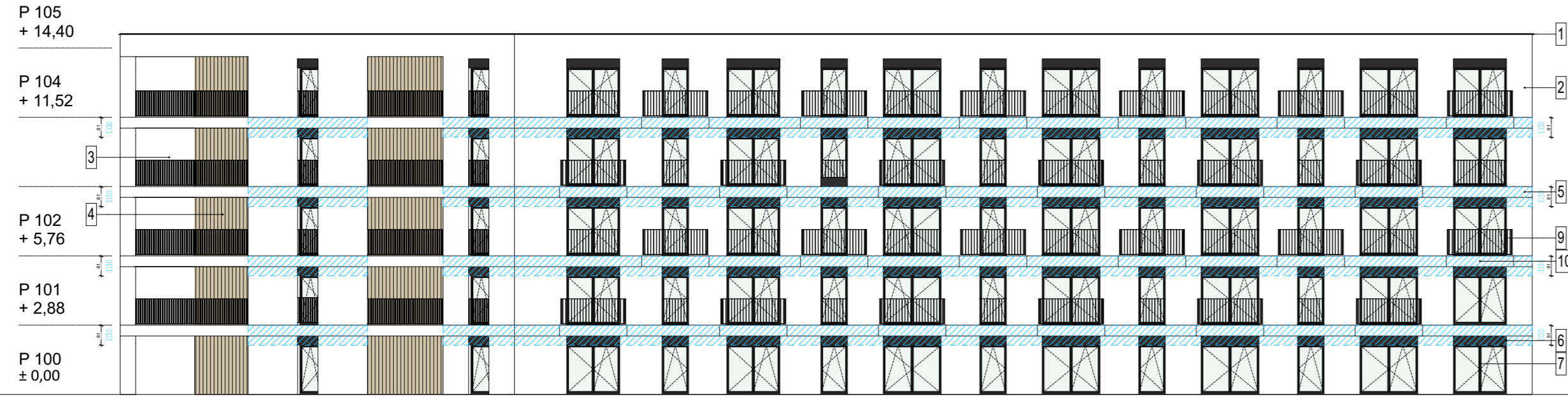
E3 - ELEWACJA PD - WSCH