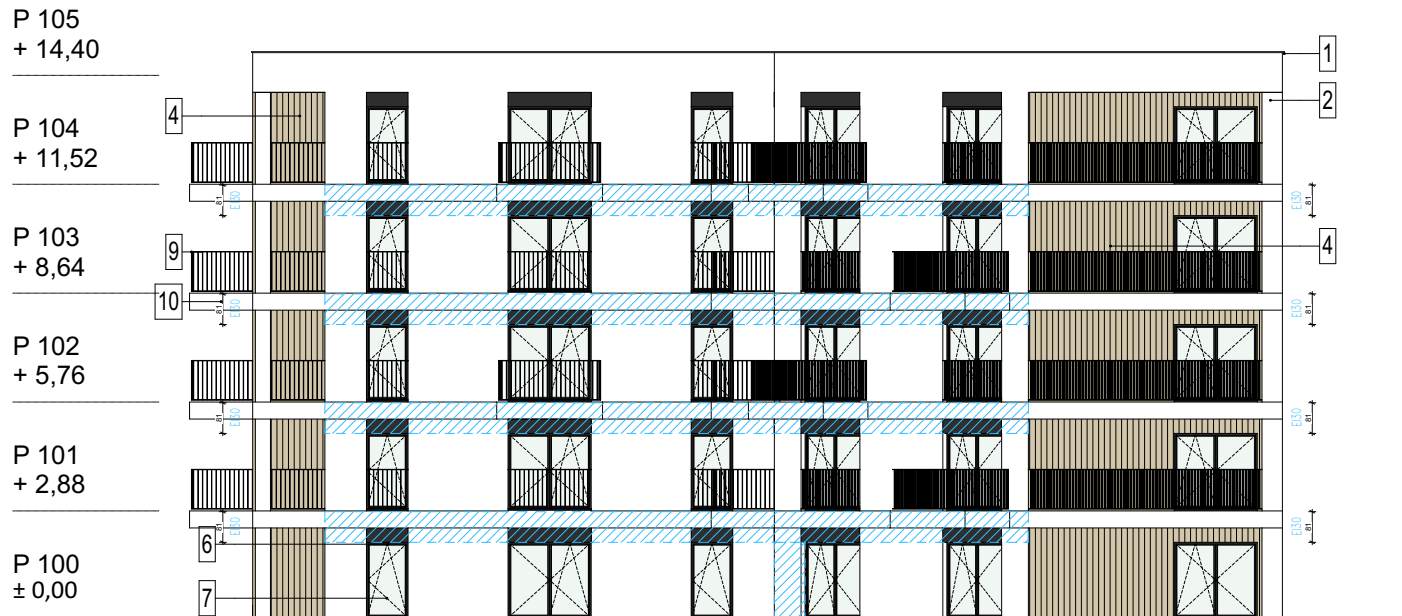
E2 - ELEWACJA PN - WSCH