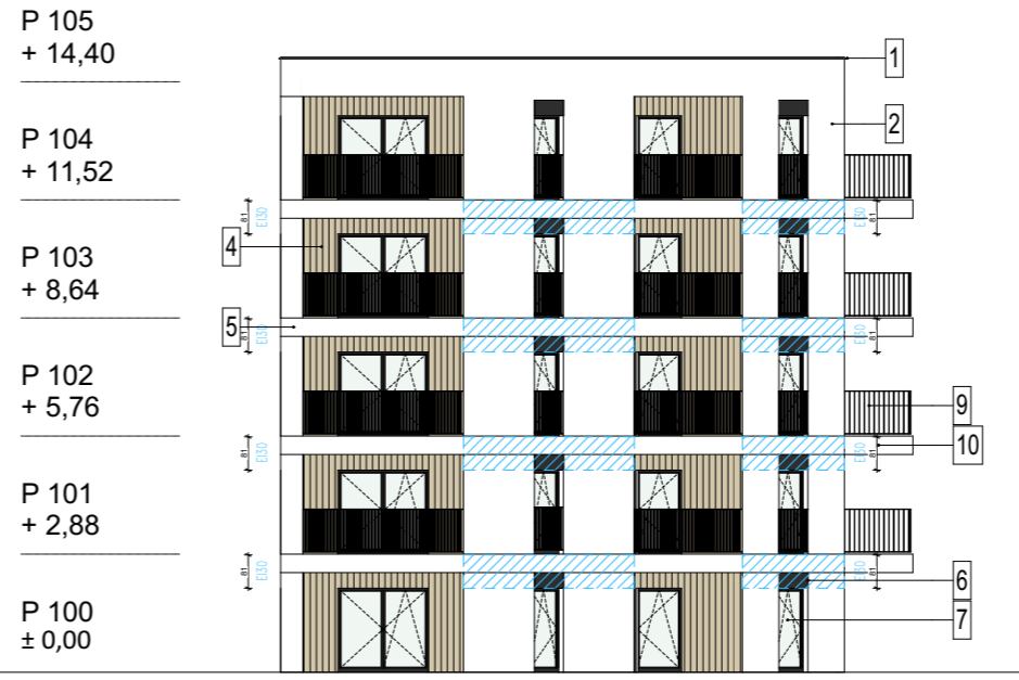
E4 - ELEWACJA PD - ZACH