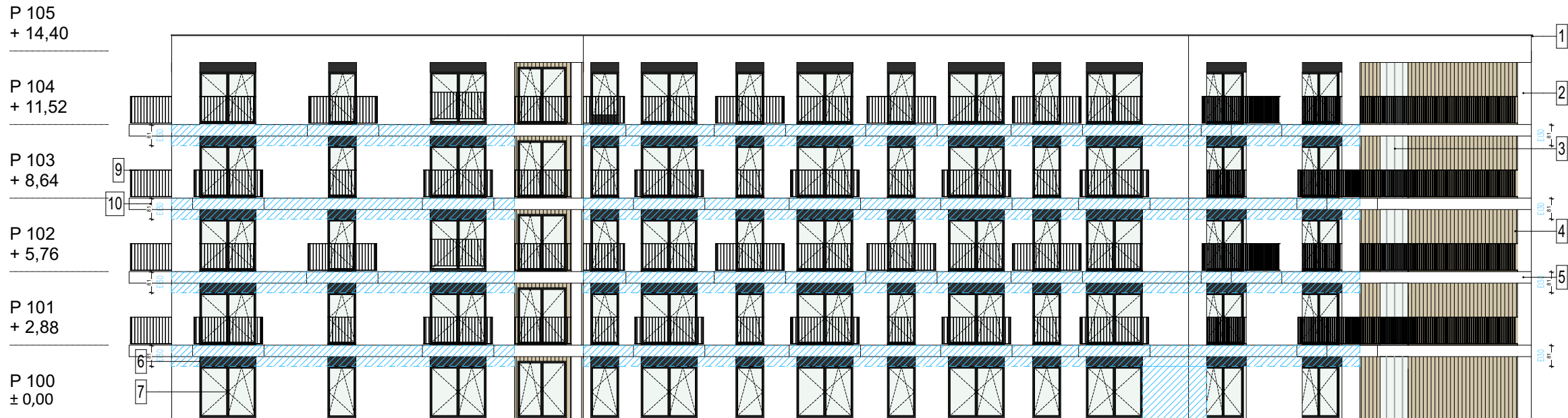
E3 - ELEWACJA PD - WSCH