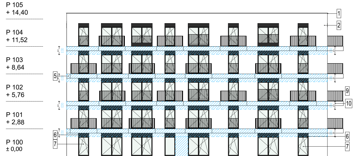
E4 - ELEWACJA PD - ZACH